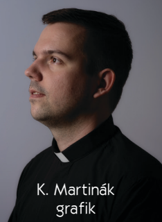
K. Martinák grafik