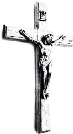
spracoval: Jozef Holka

Prežehnávanie je malou, všednou vecou. Ale náš život – i duchovný – sa skladá z malých prvkov. I toto posvätné gesto nám pomáha k veľkým zásluhám a k sebaoposväteniu.